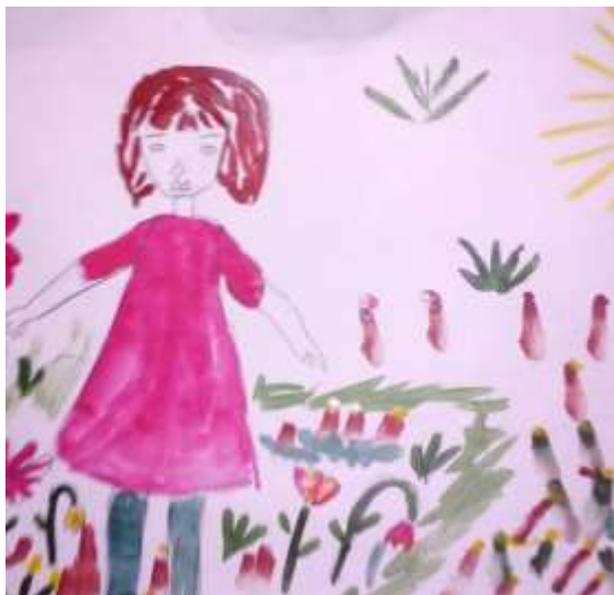
М. Зонов, 1 класс